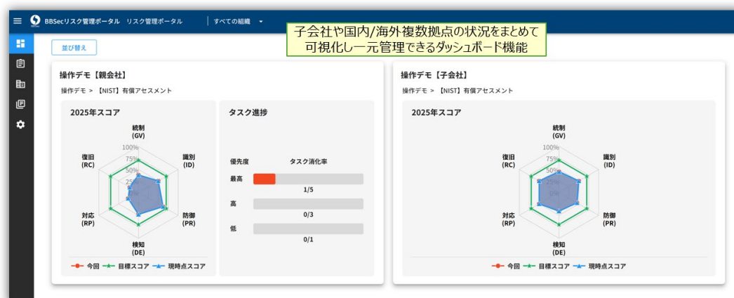
リスク管理ポータルダッシュボード